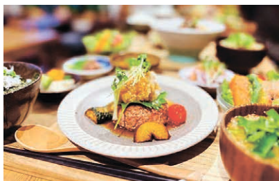
▲常陸牛ハンバーグ

おすすめスポットは「カフェ&スペース トイロ」。ハンバーグももちろん美味しいですが、一緒に付いてくるお味噌汁が絶品です。