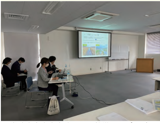
▲常陸大宮土木事務所河川整備課のプレゼンとひたちなか市河川課那珂川緊急治水対策推進室のプレゼンの様子。

令和4年10月25日(火)に、ひたちなか市市民生活部生涯学習課の事業で【こらぼ DE まなぼ～学びのとびら～】の講座として「ひたちなかの治水」を題材とした講座を開催しました。