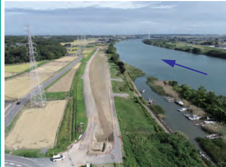
堤防整備工事（三反田地先）