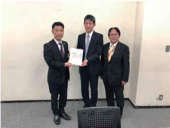
林治水課長に要望書を提出（大谷市長、大谷議長）

令和4年10月17日（月）に、国土交通省水管理・国土保全局：林治水課長に那珂川緊急治水対策プロジェクトの進捗状況等の説明や令和3年度までの御礼を行いました。今後の那珂川緊急治水対策プロジェクトの進捗について、本年度も継続要望を行いました。