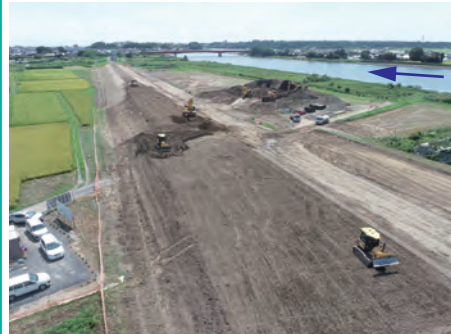
堤防整備工事（柳沢地先）