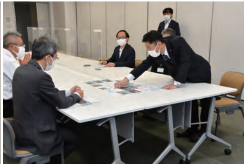
▲左の写真は、整備の進捗や要望箇所等の説明をしている大谷市長。右の写真は、副所長と整備について話している。