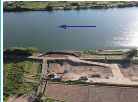
百色山排水樋管工事（三反田地先）