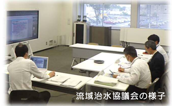
流域治水協議会の様子