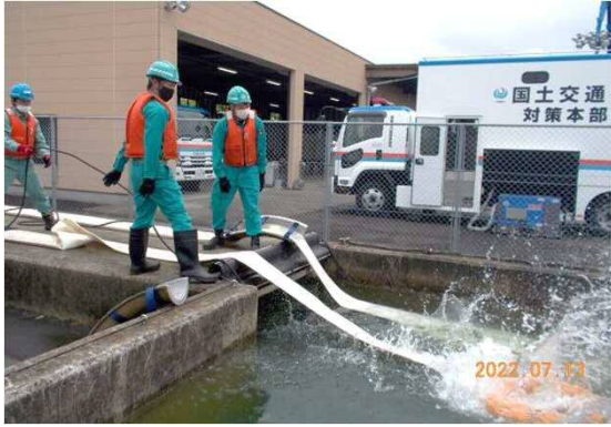
排水ポンプ車の訓練状況