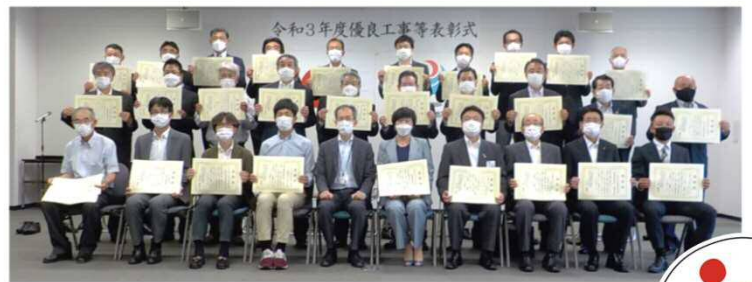
事務所長表彰受賞者