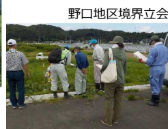
野口地区境界立会