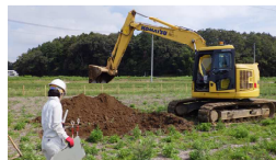
勝田地区埋蔵文化財調査