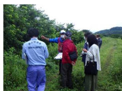
下伊勢畑地区境界立会