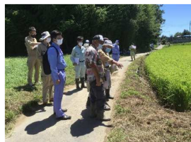
吉沼地区境界立会