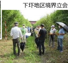
下坏地区境界立会